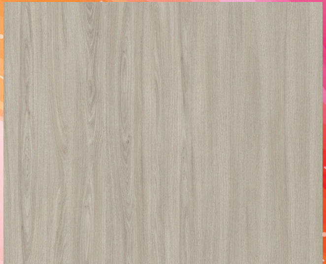
V593WT ÉMINENCE GRISE / MASTERMIND