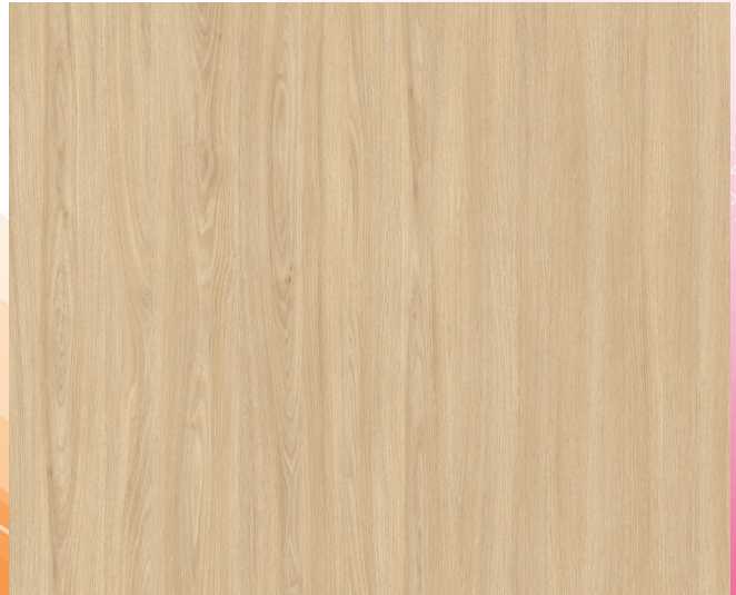
V591WT MIEL D'ACACIA / ACACIA HONEY