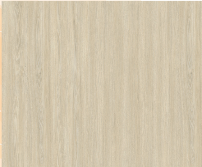
V590WT COUP DE Foudre / LOVE AT FIRST SIGHT